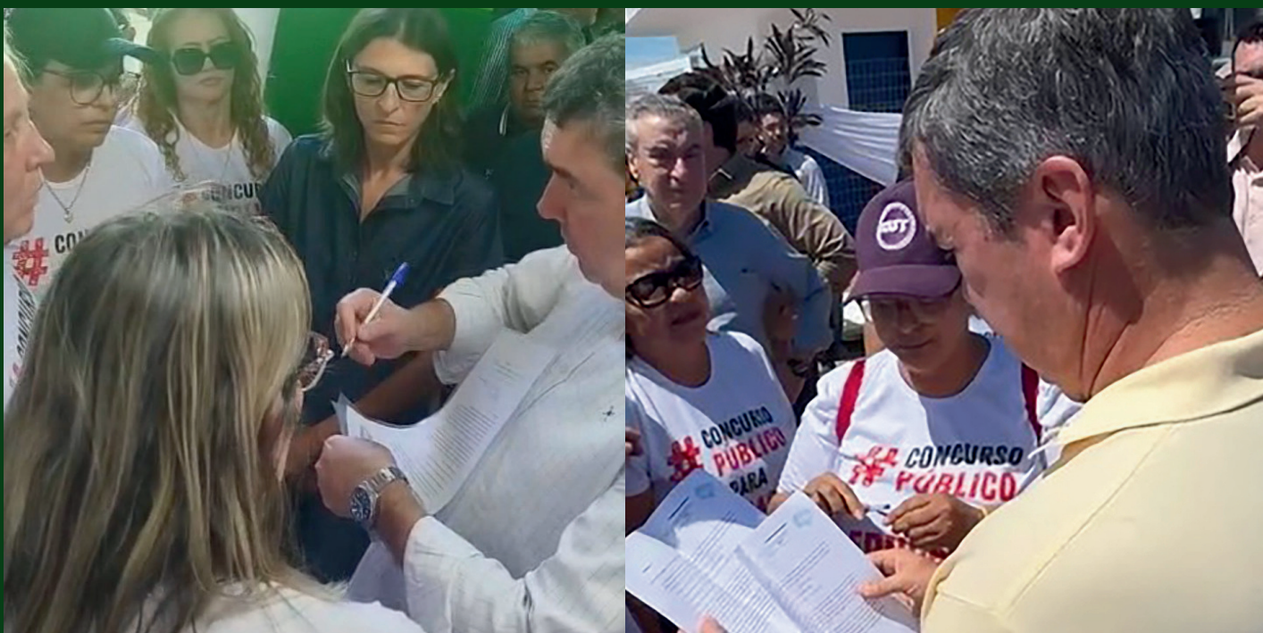
Governador assinando o documento protocolado pelos Trabalhadores em Educação.

Já no dia 9 do mesmo mês, ele foi recebido no município de Bodoquena, pela Regional de Aquidauana, com os sindicatos municipais de Aquidauana, Anastácio, Bodoquena, Dois Irmãos do Buriti e Bonito. Na oportunidade, os SIMTEDs protocolaram o documento ao governador reforçando a necessidade da realização do concurso público para a Educação do Estado.